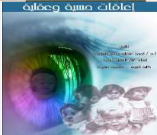
4- إعاقات حسية وعقلية Sensory and Mental Obstructions