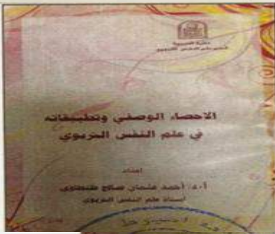
6- الإحصاء الوصفي وتطبيقاته في علم النفس التربوي