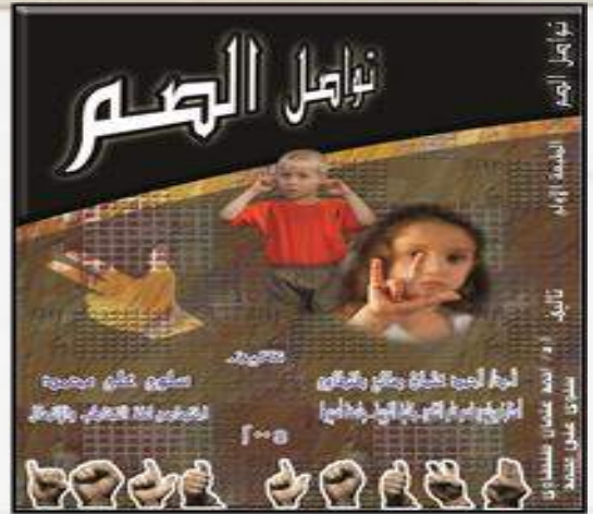
1- كتاب تواصل الصم Deaf Communication