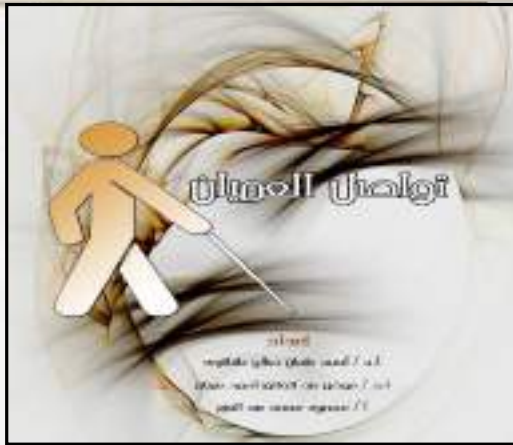
2- كتاب تواصل العميان Communication Blinds