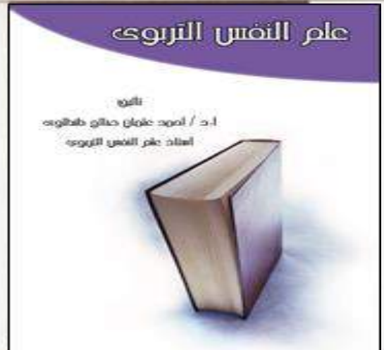
3- كتاب علم النفس التربوي Educational psychology