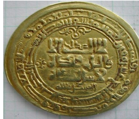
لوحة رقم (2): دينار ذهبي للسلطان "محمود الغزنوي" ضرب غزنة سنة 414هـ، وزن 4.4جم ، تنشر لأول مره في هذا البحث ، المجموعة الخاصة للأستاذ يحي جعفر .