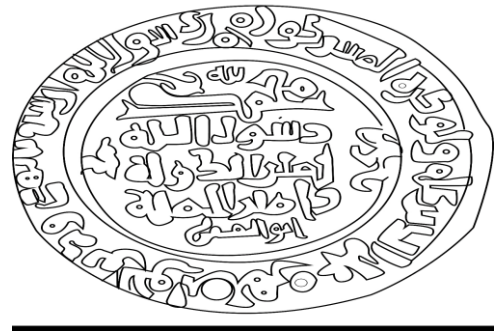
شكل (2): رسم توضيحي للدينار العلوي عمل الباحث