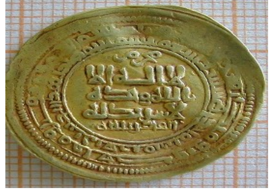
لوحه رقم (3) : دينار ذهبي للسلطان "محمود الغزنوي" ضرب غزنه سنه 421هـ، وزن 4.61جم ، ينشر لأول مره في هذا البحث ، محفوظ في المجموعه الخاصة للأستاذ يحي جعفر .