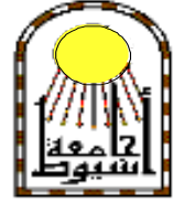
قطاع خدمة المجتمع وتنمية البيئة

الأغذية المهندسة وراثياً بين المزايا والمخاطر .