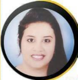
مارتينا مكرم عشم