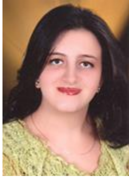
ماريز وجيه وديع ناروز منحة 30% من قيمة المصروفات الدراسية