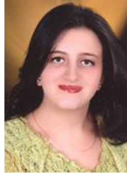
ماريز وجيه وديع ناروز منحة 3.3% من قيمة المصروفات الدراسية