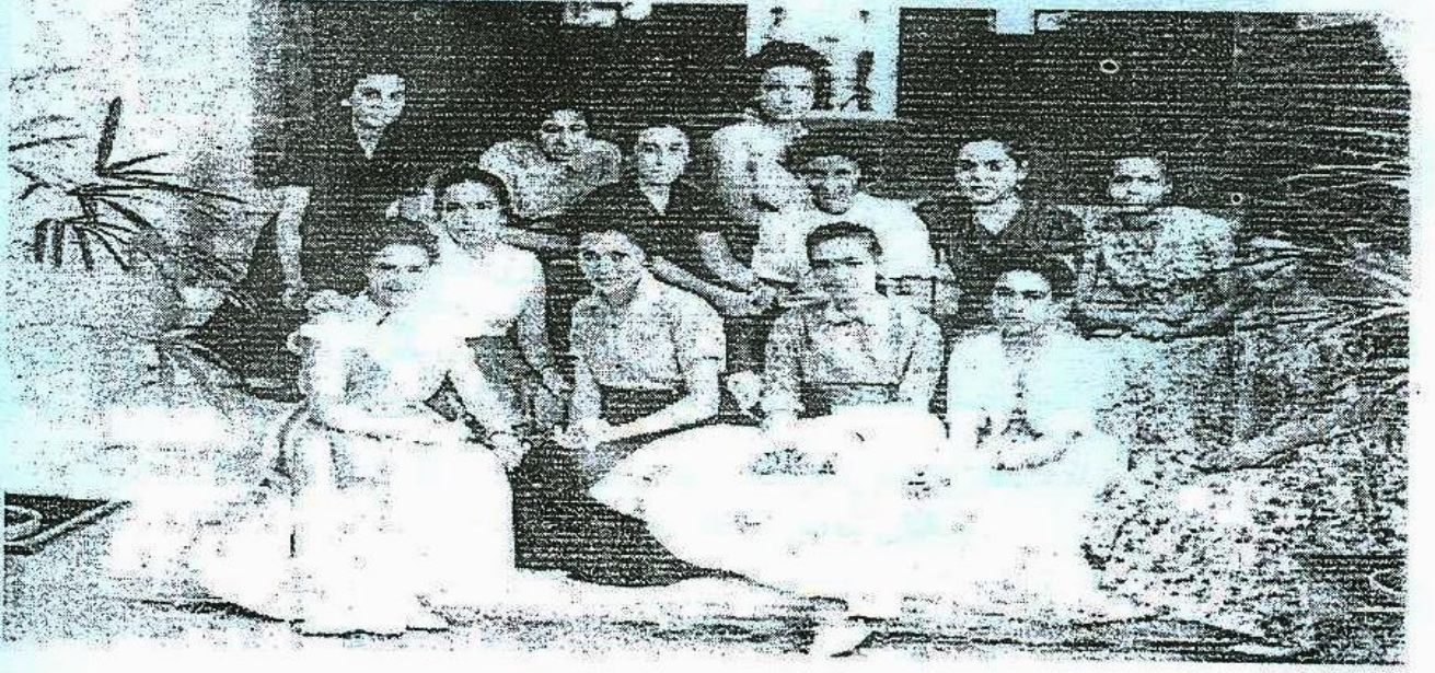
صورة تجمع الطالبات اللاتي التحقن بكلية الهندسة عام ١٩٥٧م