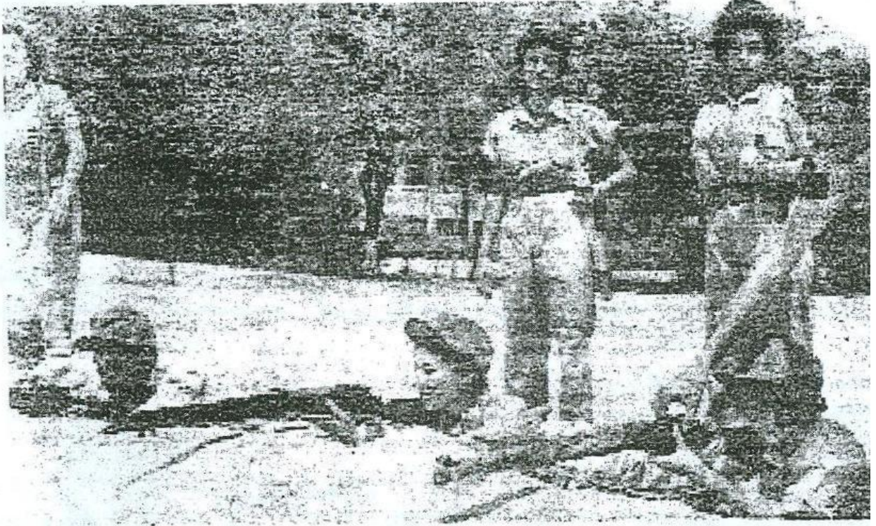
صورة للتدريبات العسكرية للطالبات عام ١٩٥٧م